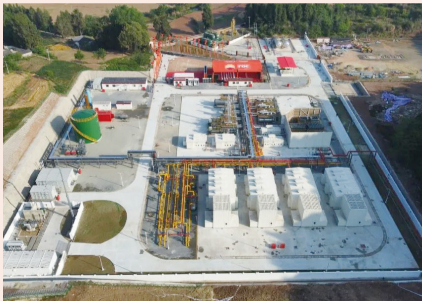
油气业务稳产增效，八角场气田增压脱烃项目2023年4月投产，二季度产量较一季度环比增长约20%，将成为未来贡献产量的重要区域之一

目前，洛克团队正在进行油田再开发和生产优化，进一步修整、评估和完善钻井计划，在2034年到期前努力推动整个合