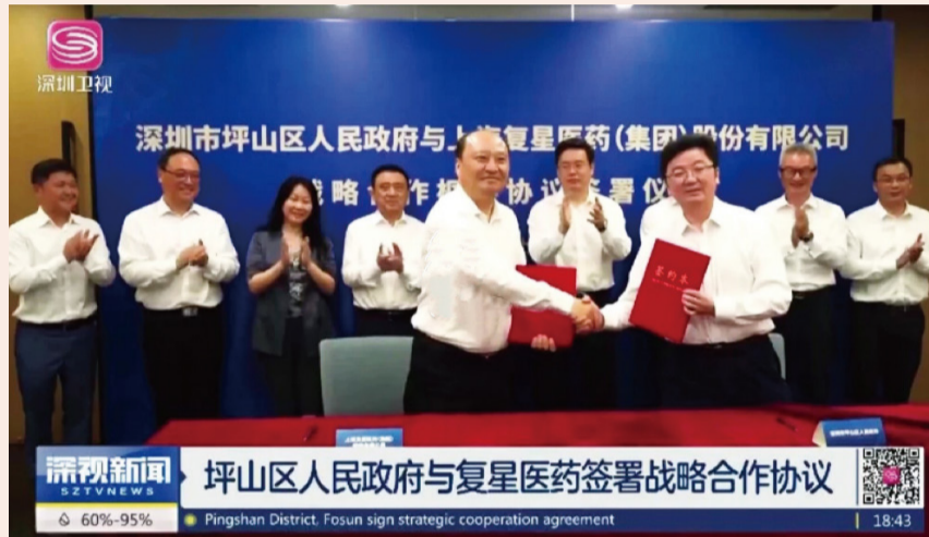
复星医药与坪山区人民政府签约

诊断、医疗健康服务等多个领域。近年来，复星医药以患者为中心、临床需求为导向，通过自主研发、合作开发、许可引进、深度