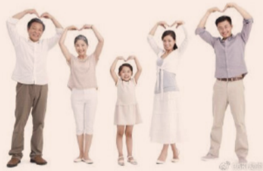
复星联合健康险为家庭筑起保障，助力实现健康中国

2023年上半年保险行业数据显示，我国居民医疗费用个人自费比例约为27%，仍然居于较高水平，据统计，商业健康险在助力构建健康中国、缓解看病贵问题上依然大有可为。