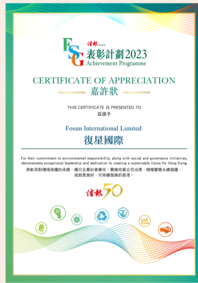
复星国际荣获《信报》颁发的“ESG 表彰计划 2023”嘉许状

ESG 50指数成份股，连续三年入选恒生可持续发展企业基准指数成份股；标普全球企业可持续发展评估成绩排名超过91%的全球同业，入选标普全球《可持续发展年鉴2023（中国版）》及获颁“行业最佳进步企业”标徽；入选富时罗素社会责任指数（FTSE4Good Index Series）成份股。