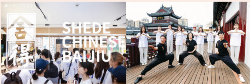
“舍得星未来”游学营让同学们对舍得智慧有了独特的领悟

同学们说，通过游学营，知识面拓宽了，美好的友谊收获了，沟通协作的能力也得到锻炼。“这不是结束，而是新的开始。”