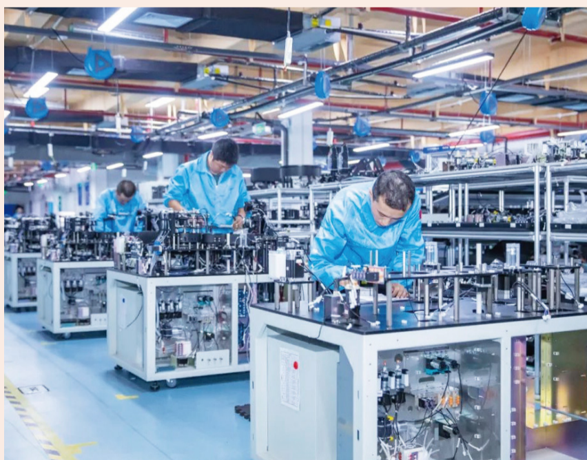
复星诊断的自主创新获权威肯定，未来将持续助力增强国家科创力量

在试剂创新研发方面，复星诊断不断推动创新技术和产品的开发落地。2023年，与上海交通大学医学院附属仁济医院、怡和生物联合申报的《新一代宫颈癌体外诊断试剂的临床研究成果转化和应用项目》荣获“2022年度上海产学研合作优秀项目一等奖”。超敏HBV核酸检测试剂、谷胱甘肽还原酶检测试剂、心肌五项检测试剂于2023年获批上市。在工艺技术流程上，与上海石墨烯产业技术功能型平台在“热管理