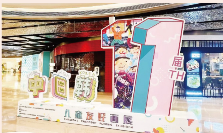
8月在上海 BFC 外滩金融中心的中日韩儿童友好画展

日本碧波会理事长鹤由香里现场致辞：“为下一代的孩子们创造交流的机会是大人们责任，三国的大人们正应继续携手合作，为青少年的培养而继续努力。”在活动现场，鹤由香里还见到了往届画展的获