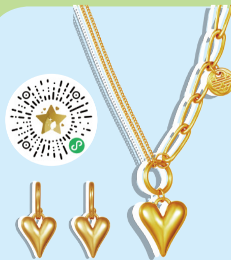
老庙有鹊婚嫁金饰