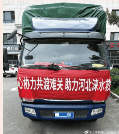
复星基金会迅速联手公益爱心伙伴驰援受灾地区

洪水无情人有情，驰援物资在多方努力下已陆续送到群众手上。此次援驰受到物美、恩派基金会、中欧校友总会及中欧校友会河北分会、中国乡村发展基金会、中国红十字基金会、中华慈善总会、上海市华侨事业发展基金会等合作伙伴的协同支持，愿灾区群众平安渡过灾情，早日回归如常。