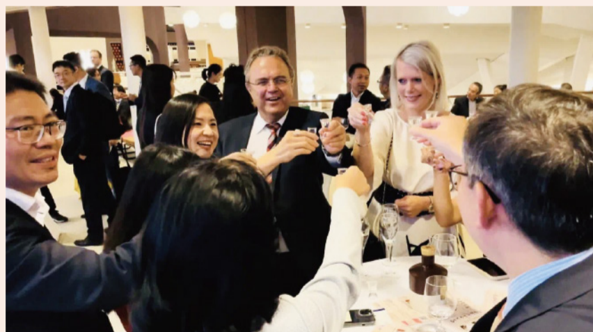
复星赋能舍得酒业全球品牌上市会，长效助力营收提升

体现在三个方面：第一，舍得酒业中高端产品保价稳增，销售收入27.57亿元，同比增加14.61%。第二，淡季控货保价获得存量渠道合作伙伴支持，新增450家经销商至2405家，较2022年末增加247