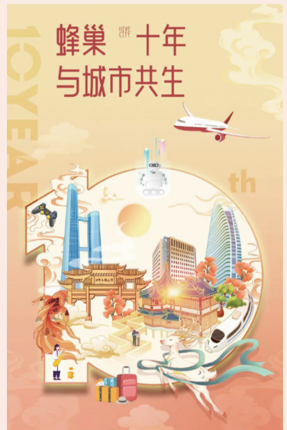
复星蜂巢的十年是与城市共生的十年

2023年，“蜂巢城市”提出十年，复星蜂巢在全球筑就金融、健康、文化、旅游、科创等多品类标杆产品。期待下一个十年，复星蜂巢模式焕发更强生机。