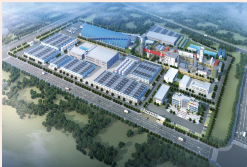
海南矿业积极推进新能源上游布局，加速战略转型，2万吨氢氧化锂项目（效果图）就是转型利器之一

二季度产量较一季度环比增长约20%，至6月底日产量已提升到200万立方米，同比2022年120万立方米的日均产量实现大幅增长。惠州12-7油田于6月获得政府批复，新增石油探明地质储量近1000万吨，