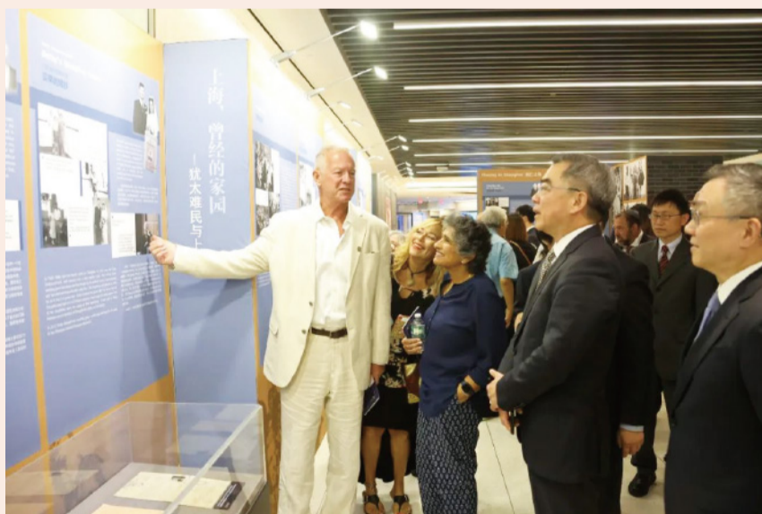
此次展览是上海犹太难民纪念馆自2020年扩建开放后首次海外推介，纽约各界近150位嘉宾出席开幕仪式并观看展览

此次展览是上海犹太难民纪念馆自2020年扩建开放后的首次海外推介活动，所展内容全部来自新馆陈设。展览精选30余名原犹太难民及其后裔的口述故事，近30件珍贵文物史料的复制品、200多张照片、纪录片视频等珍贵史料，向海外观众讲述上海曾敞开怀抱接纳犹太难民的故事。纪录片《追寻上海的犹太遗韵》英文版也在展览期间播出。