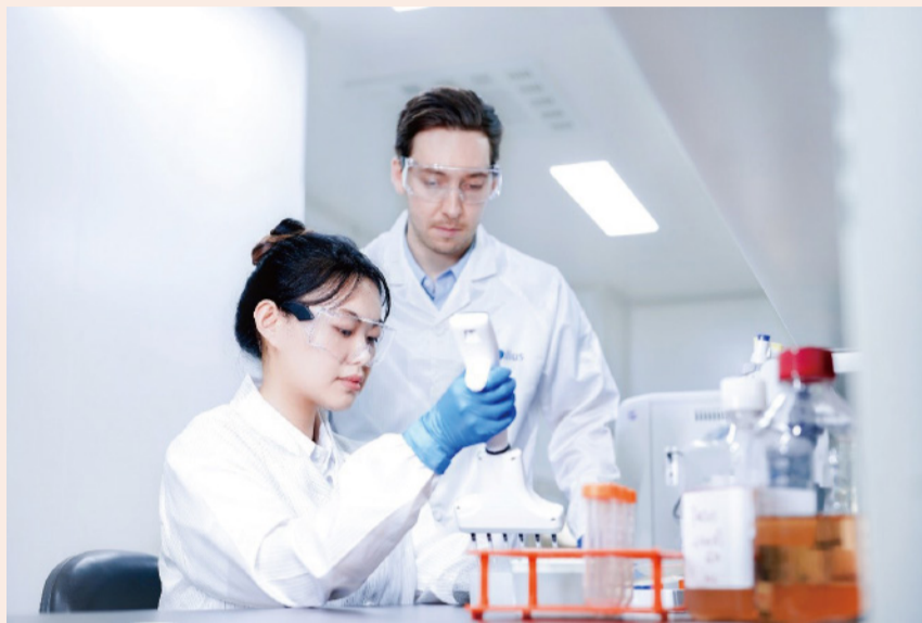
复星持续加大创新投入，穿越周期收获成果

加17%。创新，也已成为复星在沪成员企业破题高质量发展的最大公约数。在浦东，复星凯特打造了中国首款CAR-T细胞治疗药品奕凯达（阿基仑赛注射液）。在张江，2022年8月开工建设的直观复星总部及产业化基地，正加速推进国际尖端医疗设备的本土化生产。在嘉定，复星旗下智能制造核心企业翌耀科技，已成长为全球领先的工业自动化和数字化智能科技解决方案提供者。