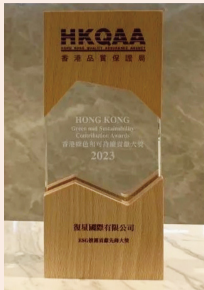
“香港绿色和可持续贡献大奖 2023”奖杯

《信报》指出，近年全球投资者愈来愈重视企业在ESG方面的绩效，复星国际也在持续推动ESG方面的工作，取得不俗的成果。复星国际MSCI ESG评级为AA，是大中华地区唯一一家MSCI ESG评级为AA的综合型企业，并连续入选MSCI CHINA ESG LEADERS 10-40；恒生可持续发展评级为A，连续两年入选恒生