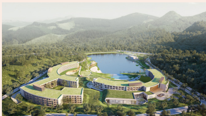
“地中海·白日方舟”南京仙林度假村概念图

“白日方舟”引入城市酒店难得一见的室内滑雪、空中飞人、桨板等，设置家庭客群可享的儿童游乐区、亲子活动区及儿童托管服务，将都市气质融入独有潮吧“U吧”的空间陈列、酒水、G.O表演及主题派